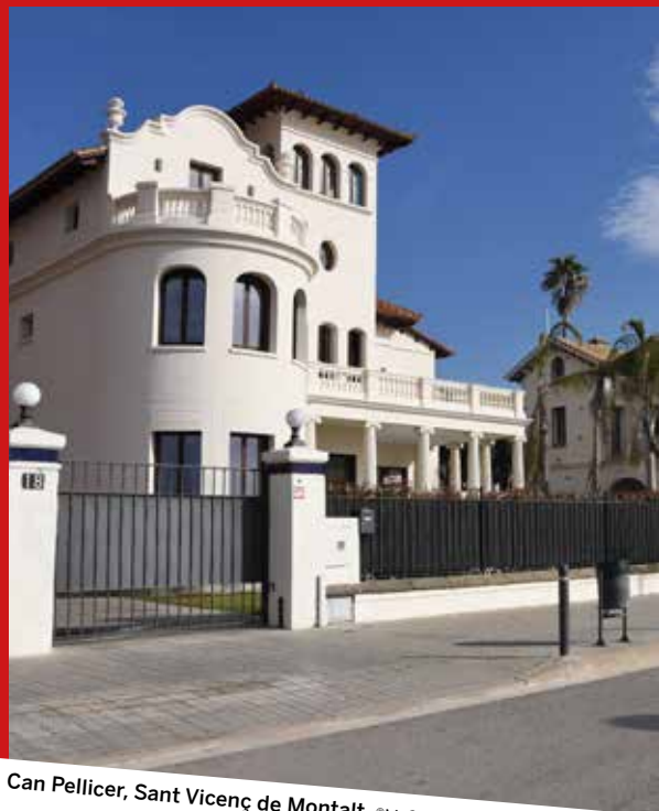
Can Pellicer, Sant Vicenç de Montalt.