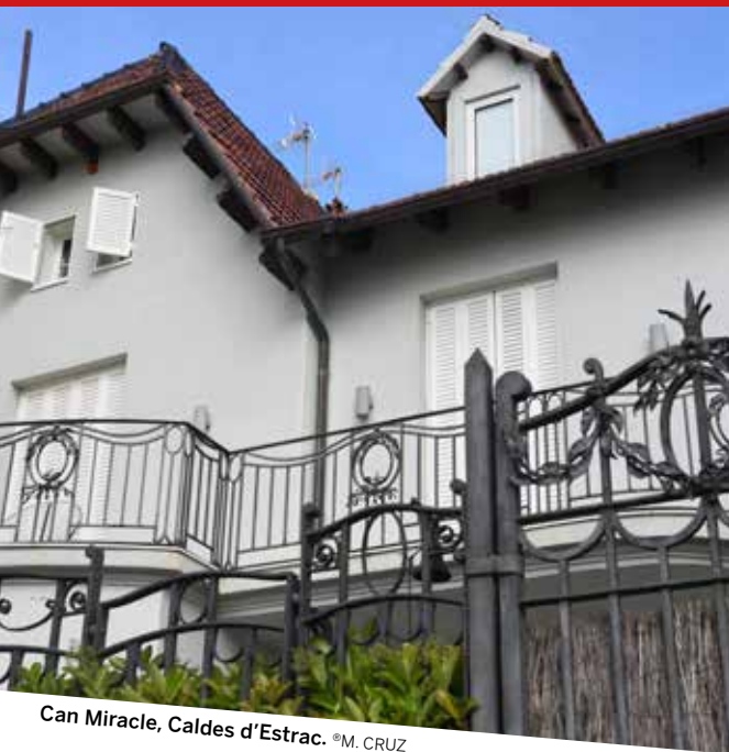
Can Miracle, Caldes d'Estrac.